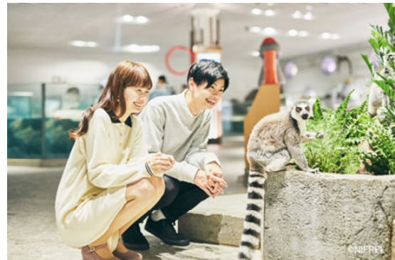
「ニフレル」の施設イメージ