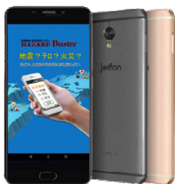
jetfonとHAZARD Buster イメージ