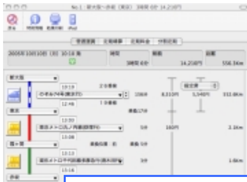
ラインカラーが引かれ見やすくなった検索結果

iPod に時刻表や検索結果をメモとして転送できます。いったん転送しておけば、外出先でも時刻表や検索結果を閲覧することが出来ます。