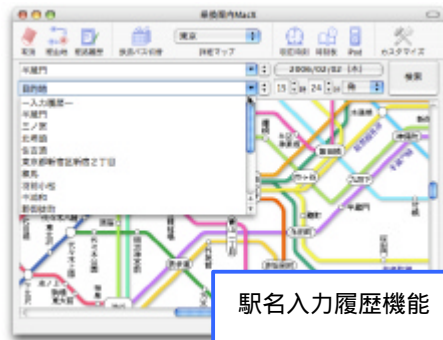
駅名入力履歴機能

小田急・京急・東急・京成・西武・国際興業バスの時刻表に対応しました。もちろんバスの時刻表は iPod にも転送して閲覧することが出来ます。