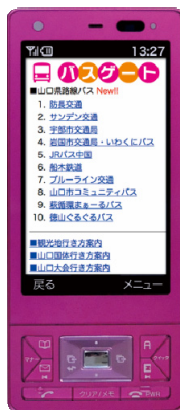
▼山口県の 路線バスに対応