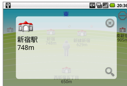
▲駅までの距離を一目で確認できます