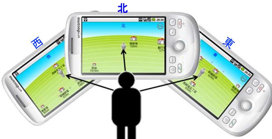
◀ 利用者が向いている方向に合わせて、画面上の表示も切り替わります