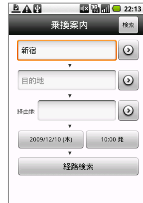
▲選択した駅は「経路検索」の出発地(目的地)欄に自動で入力されます